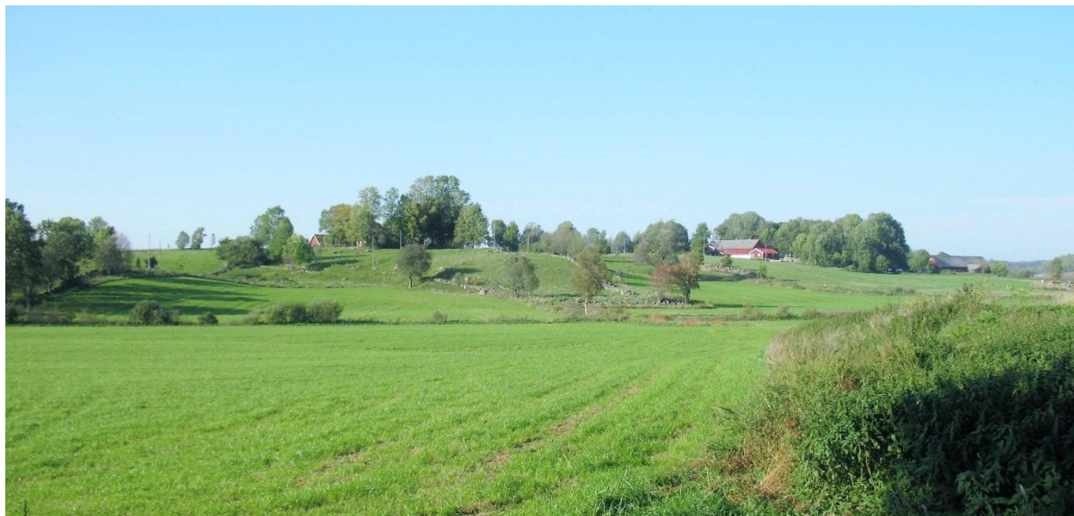
Vartofta-Åsaka, Falköpings kommun i Västra Götaland

Eikelunder som kultsteder som vel Elmevik er inne på, var aktuelle i tiden før asakulten og siden under denne opp til ca. 500 e. Kr. Senere års forskning kan tyde på at Asak som navn og fenomen skriver seg fra en forandring i kulten. Om dette vil jeg komme tilbake i et senere innlegg.