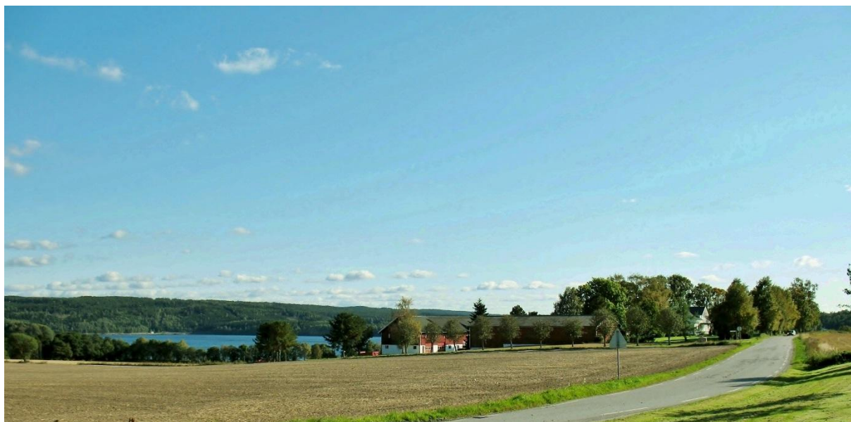
Asak i Berg sett fra kirken med utsikt mot Femsjøen 8 km fra Halden.

Dette er fortsettelsen på forrige artikkel om Asak-navnet.